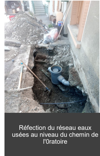
Réfection du réseau eaux usées au niveau du chemin de l'Oratoire