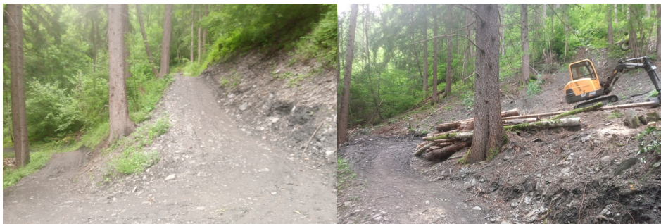
Remise en état de la piste D val'landry dans le secteur de Barbi suite aux glissements de terrain

Les travaux de la crèche avancent à grand pas. Nous avons pu la visiter avec la PMI et la future directrice. Pour l'instant, toutes les normes sont respectées ainsi que les délais de construction.